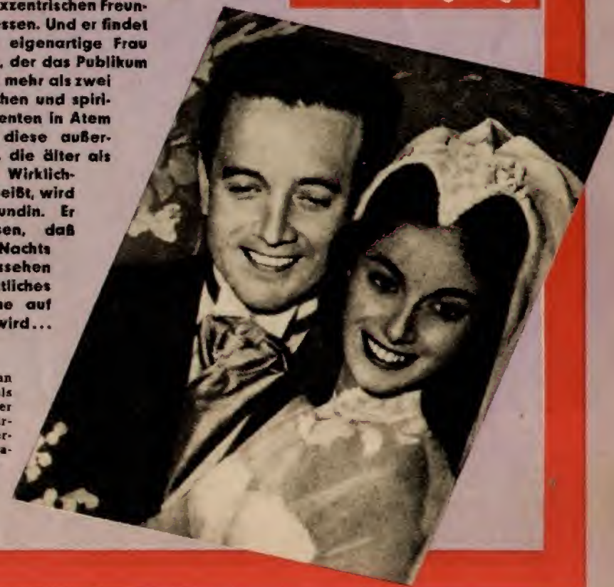
Und James Dean steht abseits, als Pier Angeli in der St. Timotheus-Kirche den Schlagersänger Vic Damone heiratet.